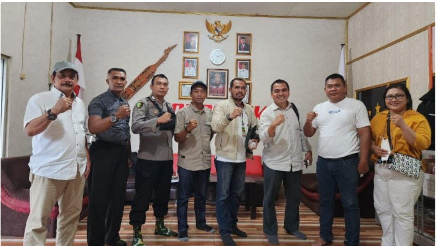
Tim PT Agasa Kalimantan Tengah

PALANGKA RAYA - PT Agasa Kalimantan Tengah (PT Agasa Kalteng) merupakan Badan Usaha Jasa Pengamanan (BUJP) Perusahaan lokal Kalimantan Tengah yang bergerak di bidang industri security, meliputi “Jasa Pelatihan Dasar SATPAM (Gada Pratama/Madya), dan Jasa Tenaga Pengamanan (Outsourcing)”.