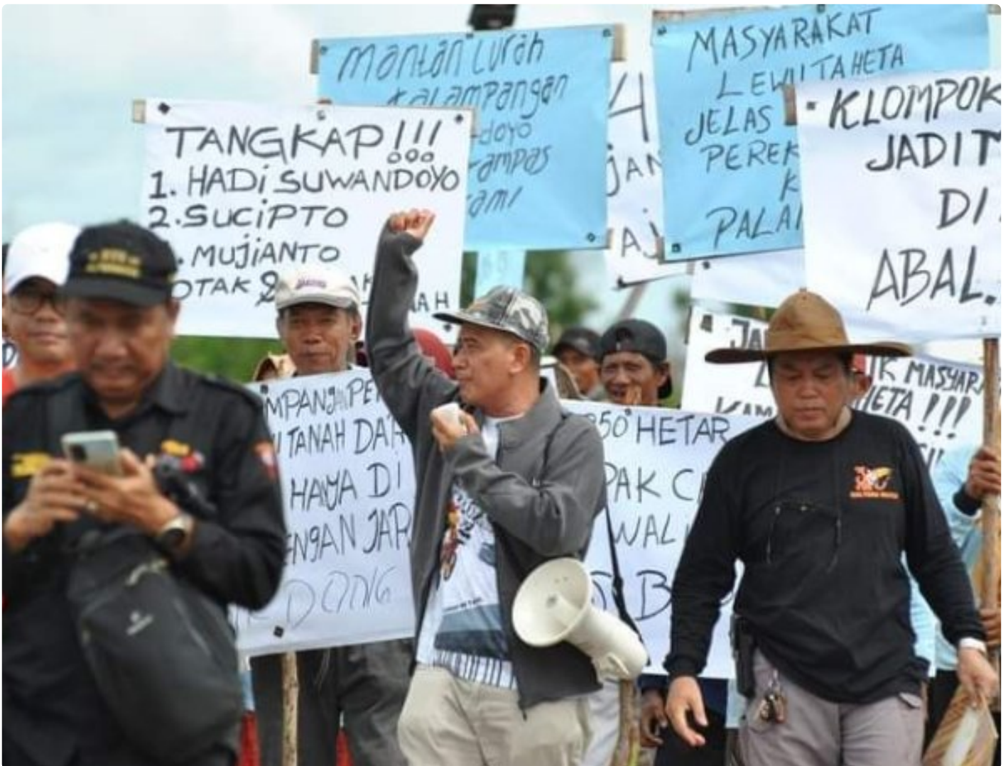
Gambar: Aksi Unjuk Rasa Masyarakat Kelompok Tani "Lewu Taheta"

PALANGKA RAYA - Sengketa kepemilikan tanah yang terjadi di Kota Palangka